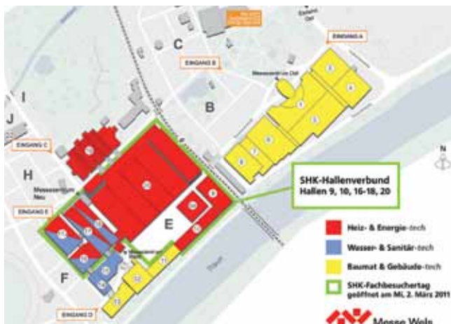
Hallen-Übersichtsplan Energiesparmesse Wels

Spezielle Info-Veranstaltungen können organisiert werden.