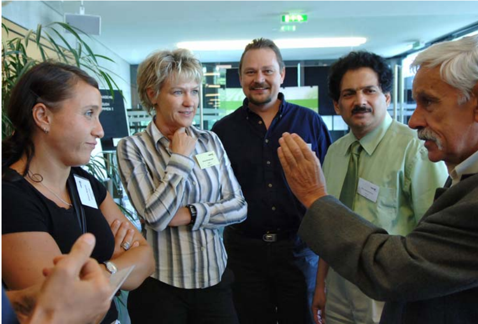
Angeregte Diskussion – schon vor Beginn der Konferenz.